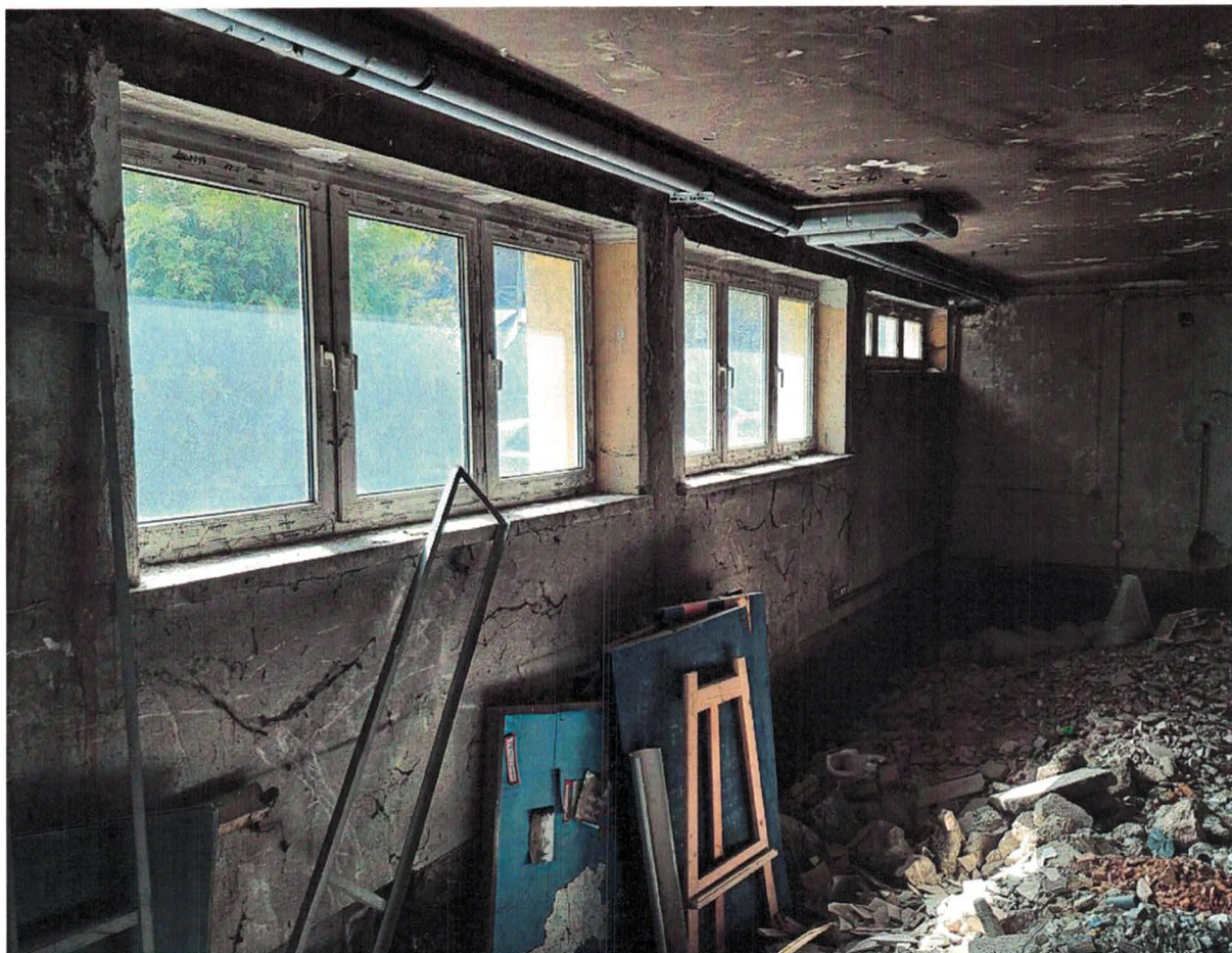
Fot.6. Pracownia Ekonomiczna / IT objęta opracowaniem_zdjęcie wejścia na zaplecze_nr 40_(nowa sala nr 0) Fot.6. Pracownia Ekonomiczna / IT objęta opracowaniem_zdjęcie wejścia na zaplecze_nr 40_(nowa sala nr 0)

STAROSTWO POWIATOWE w Cieszynie ul. Bobrek 29 43-400 CIESZYN