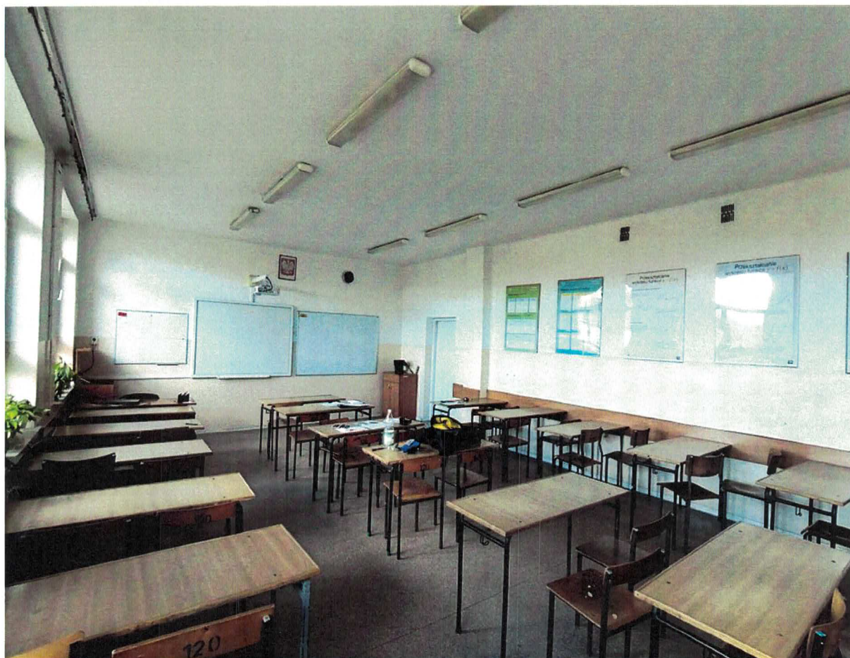
Fot.8. Pracownia Obsługi Konsumenta objęta opracowaniem_zdjęcie zaplecza_nr 125