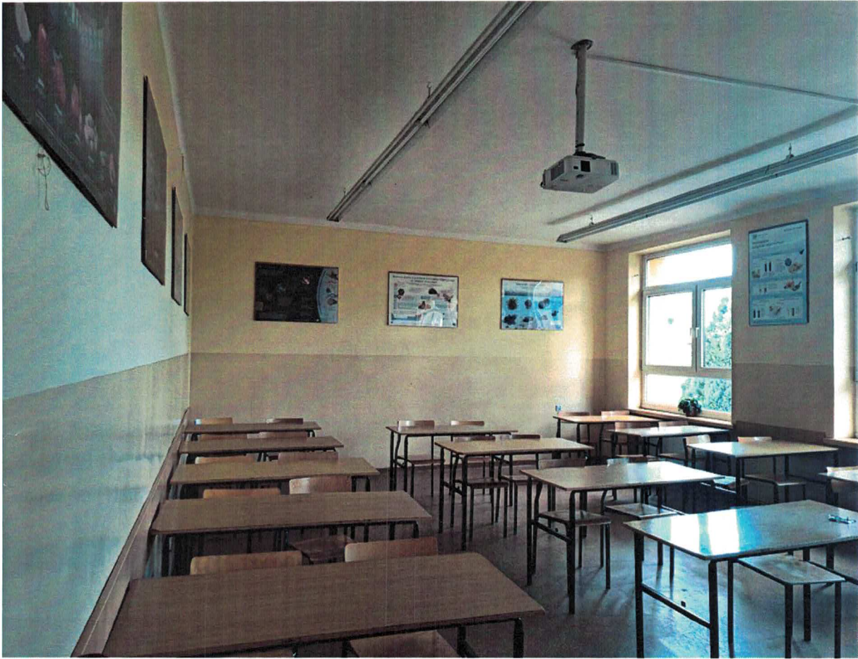
Fot.4. Pracownia Chemiczna objęta opracowaniem_zdjęcie zaplecza_nr 291

STAROSTWO POWIATOWE w Cieszynie ul. Bobrecka 29 43-400 CIESZYN