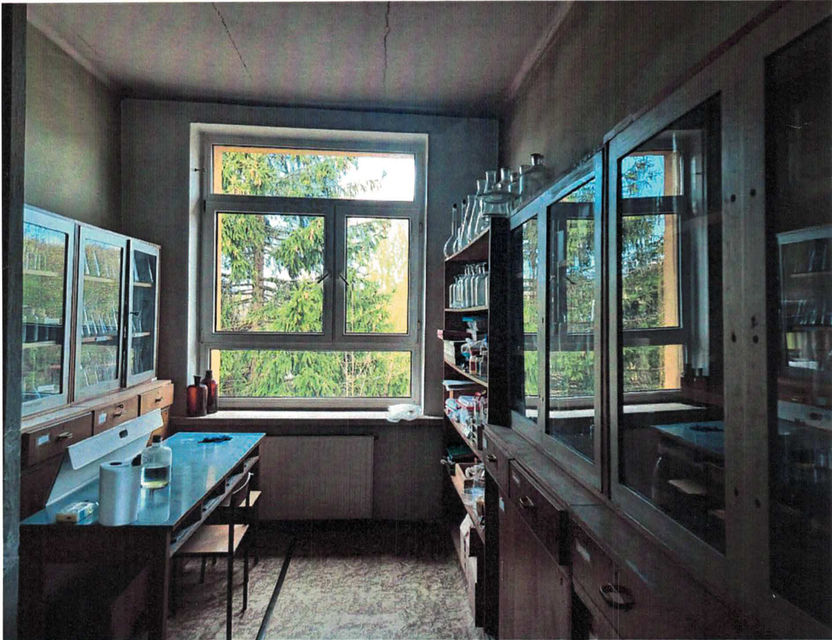
Fot.5. Pracownia Ekonomiczna / IT objęta opracowaniem_zdjęcie sali lekcyjnej_nr 41_(nowa sala nr 0)

STAROSTWO POWIATOWE w Cieszynie ul. Bolecka 29 43-400 CIESZYN