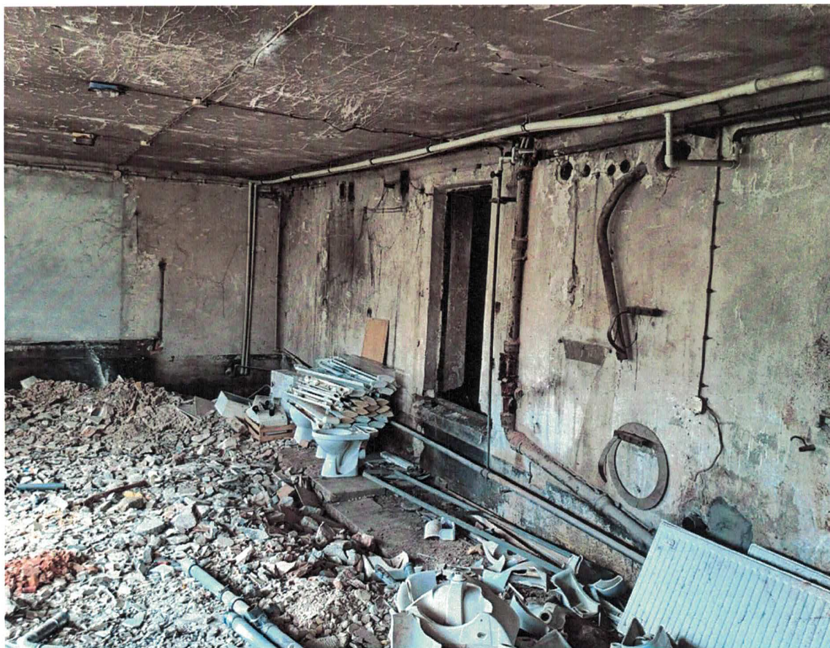
Fot.7. Pracownia Obsługi Konsumenta objęta opracowaniem_zdjęcie sali lekcyjnej_nr 120

BIURO PROJEKTOWE w Cieszynie ul. Bobrecka 29 43-400 CIESZYN