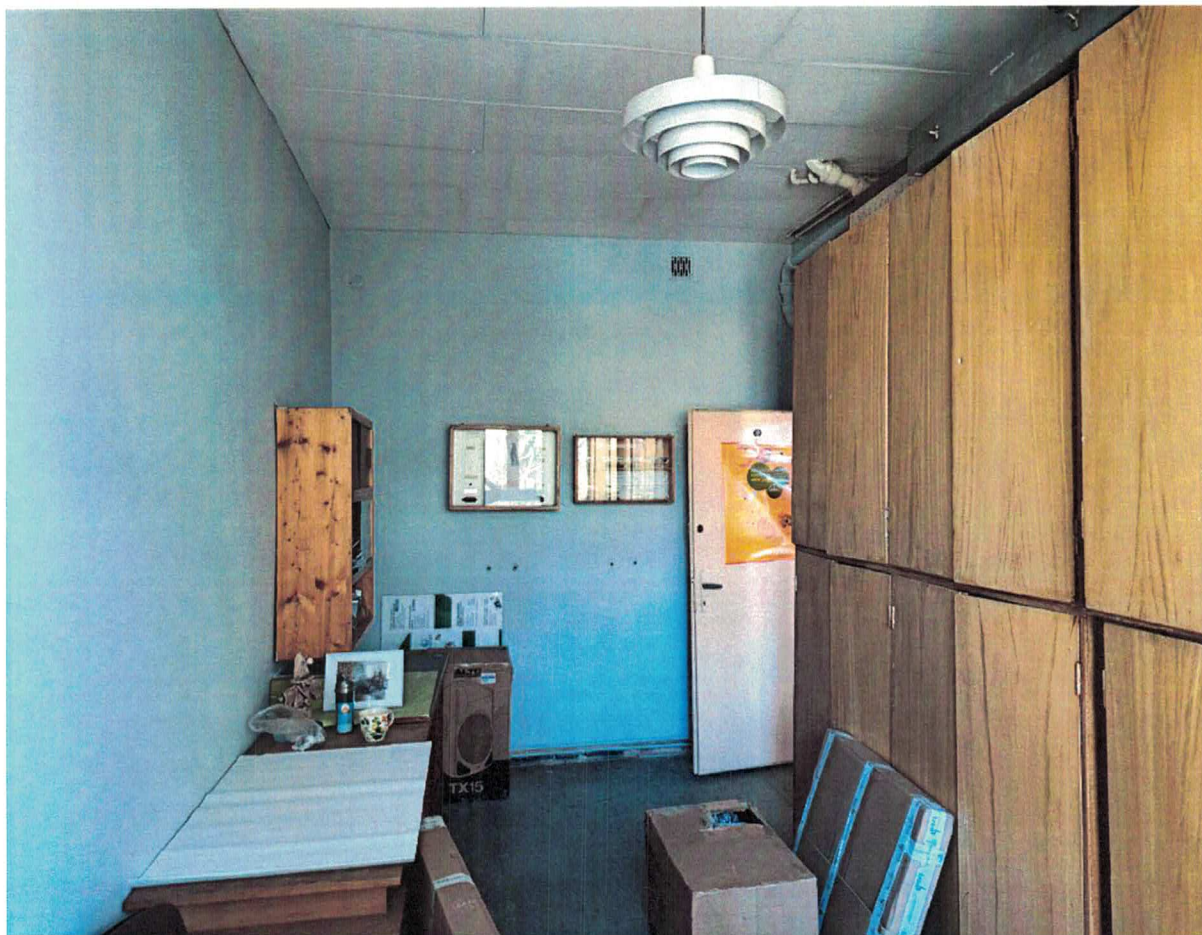
Fot.3. Pracownia Chemiczna objęta opracowaniem_zdjęcie sali lekcyjnej_nr 290

STAROSTWO POWIATOWE w Cieszynie ul. Bobrecka 29 43-400 CIESZYN