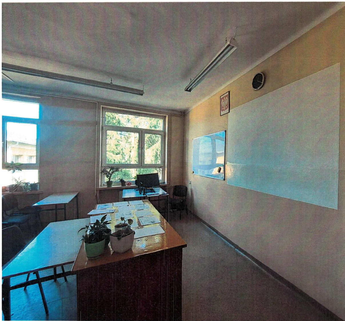
Fot.2. Pracownia Edukacji Prozdrowotnej objęta opracowaniem_zdjęcie zaplecza_nr 191

W CIESZYNIE ul. Bobrecka 29 43-400 CIESZYN